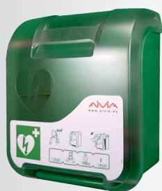
Box pro AED plastový, alarm, interiér