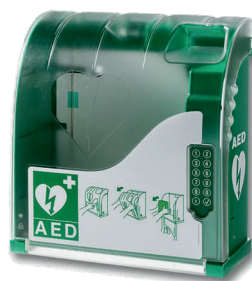
Box pro AED plastový, alarm, pin zámek, interiér / exteriér