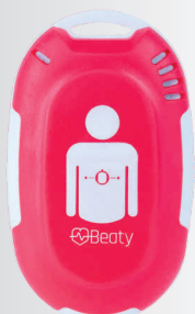
BEATY - asistent nepřímé srdeční masáže