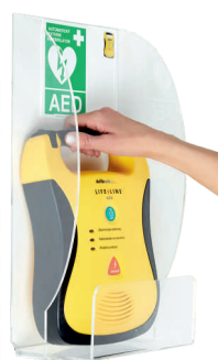
Nástěnný držák pro AED plastový