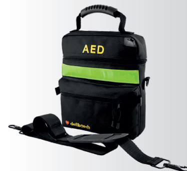
Transportní taška základní pro AED