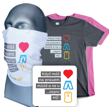
Nano-šátek „Nebojsa“ triko „Nebojsa“