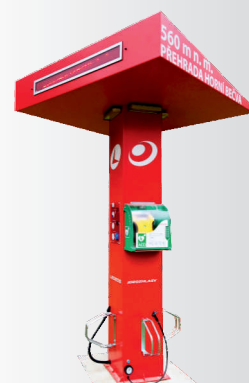
Solární multifunkční dobíjecí stanice s AED