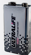
9V lithiová baterie pro denní provoz