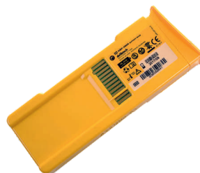
Baterie pro výboj s volitelnou životností 5 / 7 let