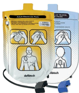
Defibrilační elektrody pro dospělé / děti