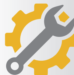
Servisní balíčky dlouhodobý pronájem AED, školení první pomoci