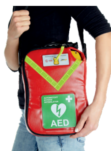
Transportní taška polstrovaná pro AED