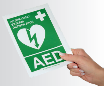
Samolepka k označení umístění AED