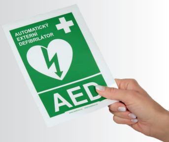
Samolepka k označeniu umiestenia AED