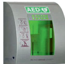
Box pre AED kovový, alarm, pin zámok, exteriér