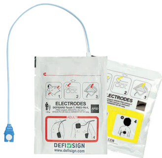
Defibrilačné elektródy pre dospelých/deti