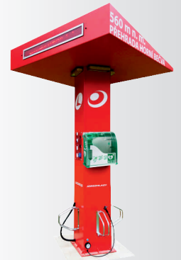
Solárna multifunkčná dobíjacia stanica s AED