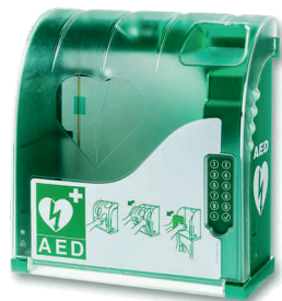
Box pre AED plastový, alarm, pin zámok, exteriér