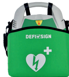
Transportná taška pre AED