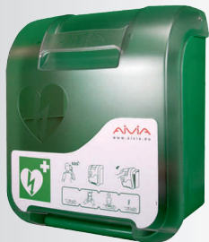
Box pre AED plastový, alarm, interiér