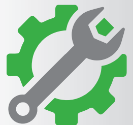
Servisné balíčky, dlhodobý prenájom AED, školenia prvej pomoci