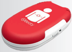
Asisten nepriamej masáže srdca „Beauty“